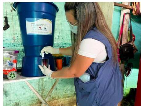
Toma de muestras calidad de agua en AHI SAFER SARAVENA 2023. Arauca, 2023.