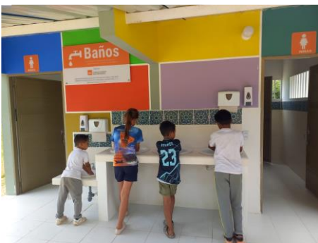
Mejoramiento de baterías sanitarias del Centro Educativo La Palestina-Sede Lejanías. Tame, Arauca, 2023.

Finalmente, se ha brindado acceso seguro a instalaciones mejoradas de saneamiento y salud ambiental a un total de 12.984 personas. Las atenciones en saneamiento en gran medida corresponden al acceso a servicios sanitarios en puntos de atención migratoria. Las personas beneficiarias han sido atendidas en menor medida con labores de construcción, rehabilitación y/o mejoramiento de sistemas para tratamiento de aguas residuales (18%) y de sistemas para el acceso a los servicios de saneamiento, como letrinas, baterías sanitarias, orinales (2,6%).